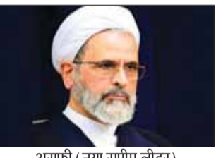
अराफी (नया सुप्रीम लीडर)