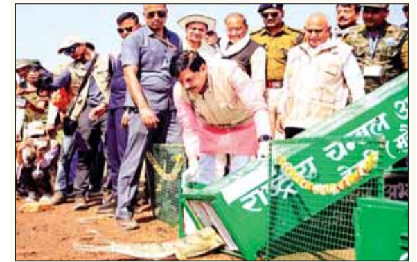
घड़ियाल को नदी में छोड़ते सीएम डॉ. यादव

नागपुर। नागपुर जिले के कटाल तहसील के राऊराख में एक औद्योगिक विस्फोटक बनाने वाली कंपनी एस्बीएल एनजी लिमिटेड के कारखाने में जोरदार धमाका हुआ। जिसमें अब तक 18 लोगों की मौत हो गई। 18 से ज्यादा गंभीर व्रताए जा रहे हैं। एस्बीएल एनजी लिमिटेड देश की प्रमुख औद्योगिक और खनन विस्फोटक निर्माता कंपनी है।