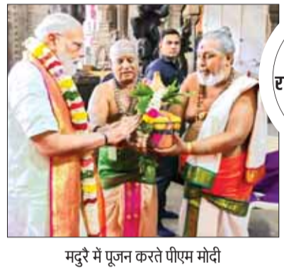
मदुरै में पूजन करते पीएम मोदी

तमिलनाडु में दो प्रमुख राजमार्ग परियोजनाओं की आधारशिला रखी