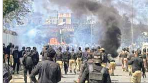
पाकिस्तान के कराची में प्रदर्शन करते लोग

श्रीनगर के लाल चौक पर शनिवार को कश्मीरी शिया मुसलमानों ने जमकर प्रदर्शन किया। लाल चौक पर प्रदर्शन कर रहे लोगों ने कहा कि यह हमला पूरी मानवता और संप्रभुता पर प्रहार है। पाकिस्तान के कब्जे वाले गिलगित-बाल्टिस्तान क्षेत्र के स्कर्टू शहर में सैकड़ों प्रदर्शनकारी सड़कों पर उतरे। प्रदर्शनकारियों ने स्कर्टू में संयुक्त राष्ट्र से जुड़े एक कार्यालय में आग लगा दी। प्रदर्शनकारियों ने अमेरिकी दूतावास पर धावा बोल दिया और दीवार फांदकर अंदर घुसने की कोशिश की। इस दौरान हुई गोलीबारी में 12 प्रदर्शनकारियों की मौत हो गई और 30 से अधिक घायल हो गए।