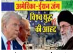
अमेरिका-ईरान जंग विश्व युद्ध की आहट

24 घंटे से पूरा अरब जल रहा है। अमेरिका इजराइल ने मिलाकर करीब 1200 बमों व करीब 2 हजार मिसाइलों से तेहरान को मिट्टी-मिट्टी व धुआं-धुआं कर दिया है। वहीं, ईरान ने भी 8 अरब देशों के साथ इजराइल व अमेरिका के सैन्य अड्डों पर मिसाइलों बरसाई हैं। इन हमलों में इजराइल व अमेरिका का दावा है कि ईरान के सर्वोच्च नेता खामेनेई व उसके 40 प्रमुख लोगों का खत्मा कर दिया गया है। हमले के समय खामेनेई कमांडर्स के साथ मीटिंग कर रहे थे। खामेनेई के मारे जाने पर ईरान में 40 दिन का राजकीय शोक और सात दिन की छुट्टी घोषित कर दी गई है। ईरानी इस्लामिक रेवोल्यूशनरी गार्ड कॉर्प्स (आईआरजीसी) ने कहा कि हमने एक महान नेता खो दिया है।