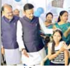
शुक्ल ने किया शुभारंभ।

उप मुख्यमंत्री शुक्ल ने मिशन मधुहारी का शुभारंभ भी किया। उन्होंने कहा कि मधुमेह को नियंत्रित करने के लिए आदर्श जीवनशैली, संतुलित आहार और समय पर पहचान अत्यंत आवश्यक है। यह पहल टाइट-1 डायबिटीज से पीड़ित बच्चों एवं किशोरों के समग्र उपचार एवं देखभाल के लिए शुरू की गई है। टाइट-1 मधुमेह ऐसी स्थिति है जिसमें शरीर में इंसुलिन का निर्माण नहीं होता और आजीवन उपचार का आवश्यकता होती है।