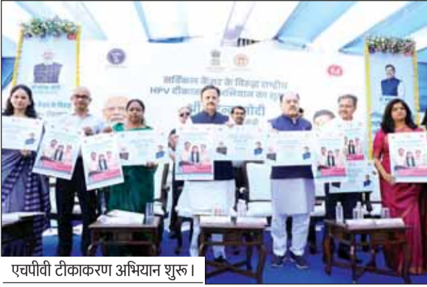
एचपीवी टीकाकरण अभियान शुरू।